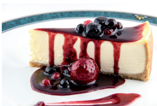
New york Cheesecake . Genuina tarta de queso americana, diferente a las de aquí, con suave queso y salsa de frutos del bosque ..... 6,60€