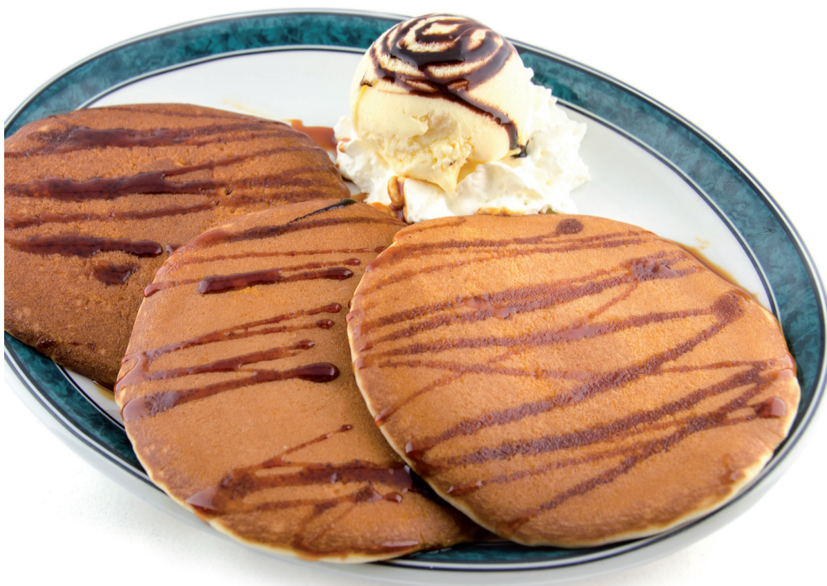
Tortitas (3) a la plancha con nata, bola de helado y sirope de frutas del bosque, chocolate o caramelo ..... 6,10€

El precio en terraza aumentará un 12% del precio de barra. Disponemos de carta de alérgenos.