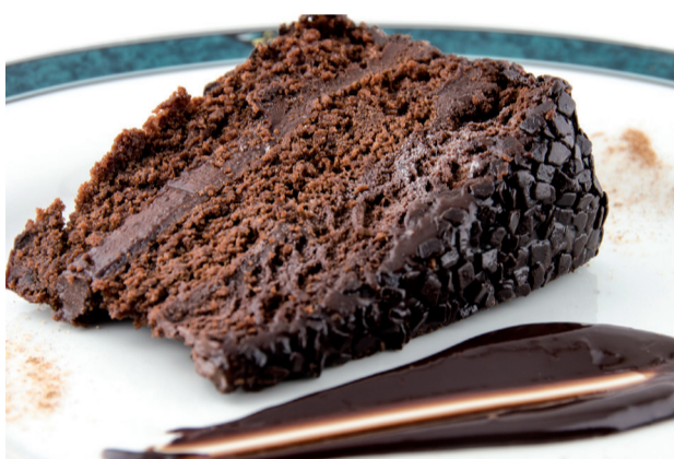
La auténtica Muerte por chocolate . Morirte no te mueres, pero está de muerte ..... 6,60€